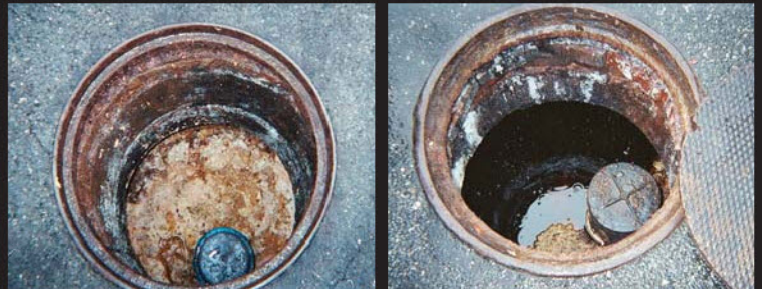
Sistema sin tratar

Las fotos muestran trampas exteriores de grasas de 1000 galones o más de restaurantes de asados o churrasquerías.